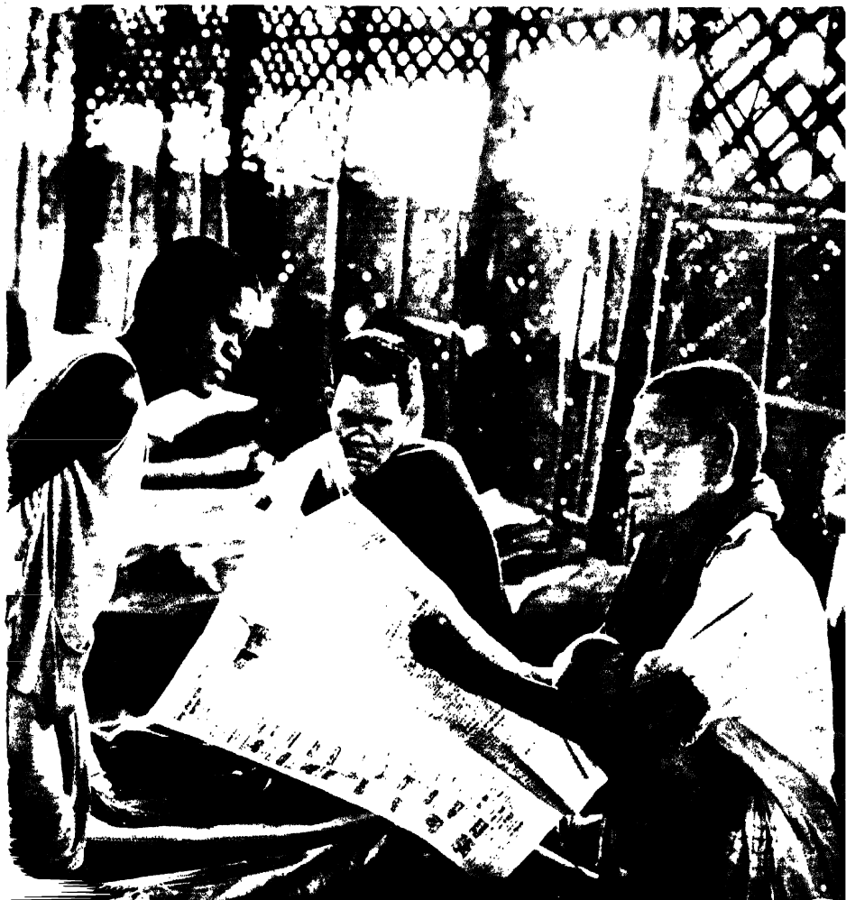
कुए रोगीहरूको केन्द्र